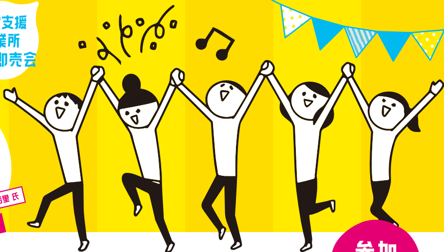
河内 裕里氏 シヨクバンク