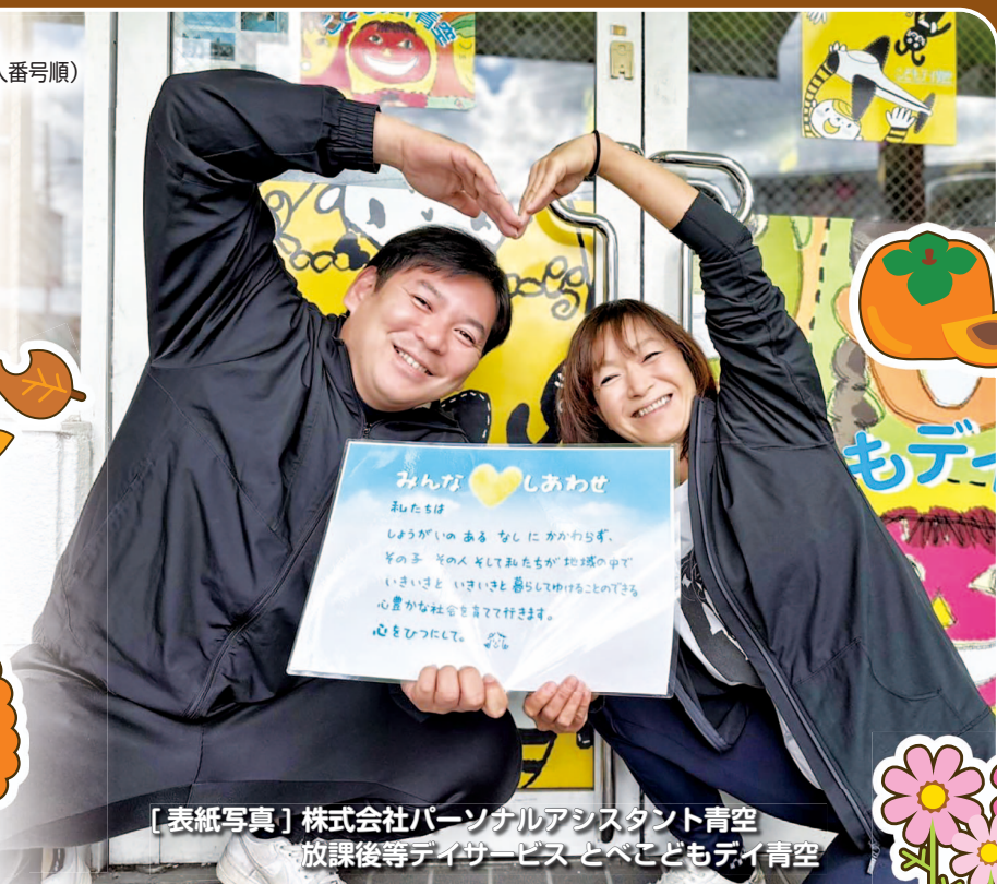
〔表紙写真〕株式会社パーソナルアシスタント青空 放課後等デイサービス とべこどもデイ青空