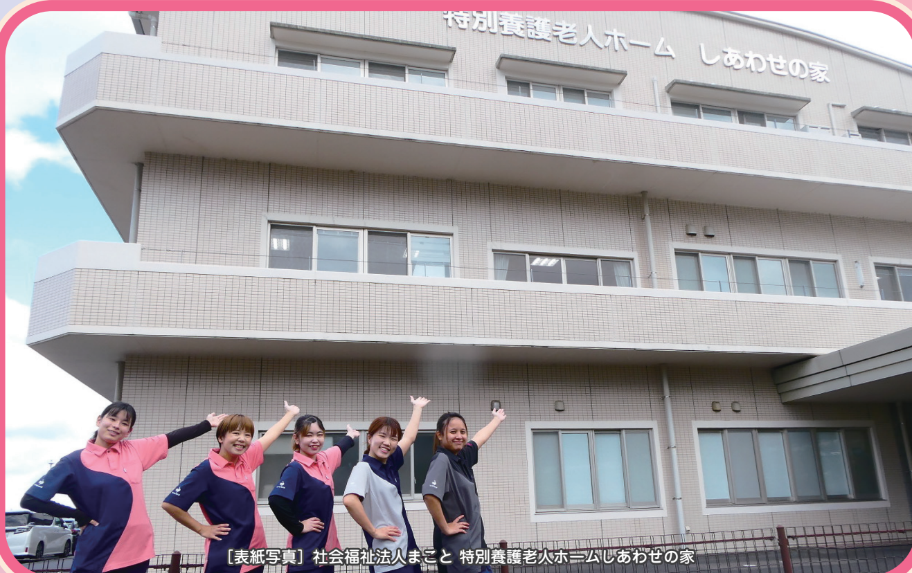
〔表紙写真〕 社会福祉法人まこと 特別養護老人ホームしあわせの家