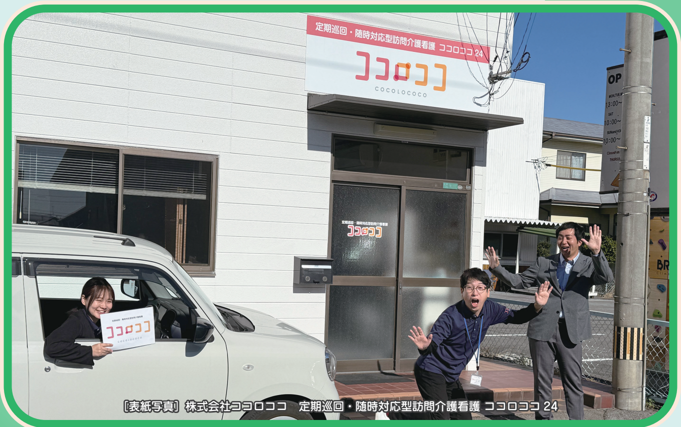
〔表紙写真〕株式会社ココロココ 定期巡回・随時対応型訪問介護看護 ココロココ 24